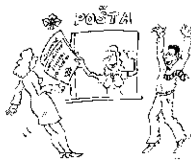
Kresba Pavel Kotyza

K výhodám už jen dodejme, že kromě nadprůměrné úrokové sazby Česká pojišťovna jako jediná nabízí možnost výběru peněz již v průběhu pojištění, a to prostřednictvím ČP Kreditní karty. Pojišťovna lze i ručit za hypoteční nebo ji-