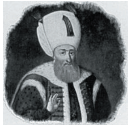
Turecký sultán Sulejman.

V roce 1414 bylo území drnholeckého panství úplně osazeno (až na pustou ves Pavlovice), a to obyvatelstvem téměř výlučně německým. Všechny obce byly poměrně velké. Můžeme si proto představit, jakými