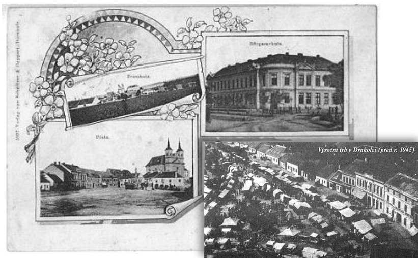
Obrázky z doby, kdy již jednou byl Drnholec městysem.