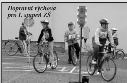
Dopravní výchova pro I. stupeň ZŠ