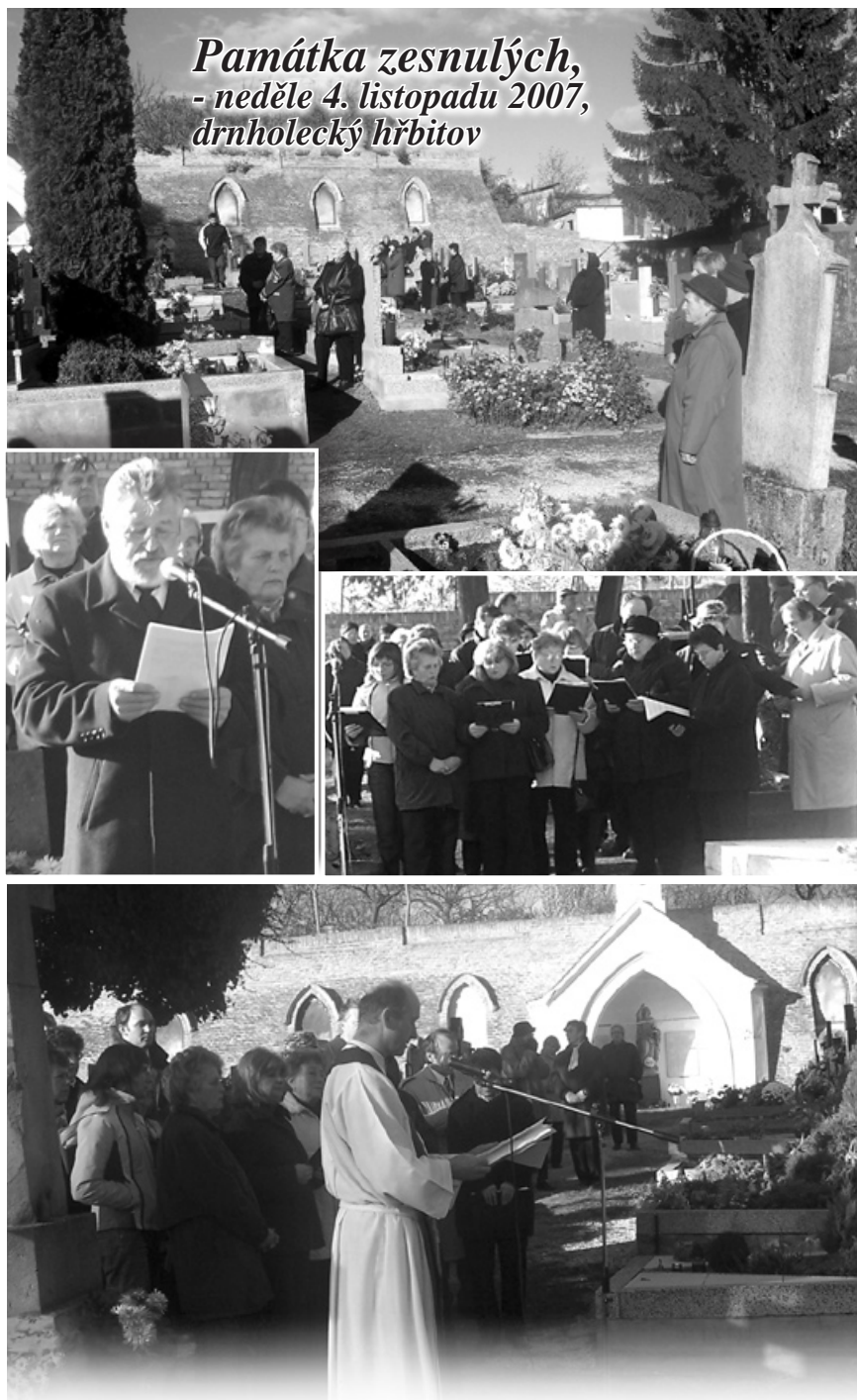
Památka zesnulých, - neděle 4. listopadu 2007, drnholecký hřbitov

Na pietní akcích za zemřelé jsme si připomněli tyto naše spoluobčany, kteří nás v roce 2007 opustili navždy. Byli to: