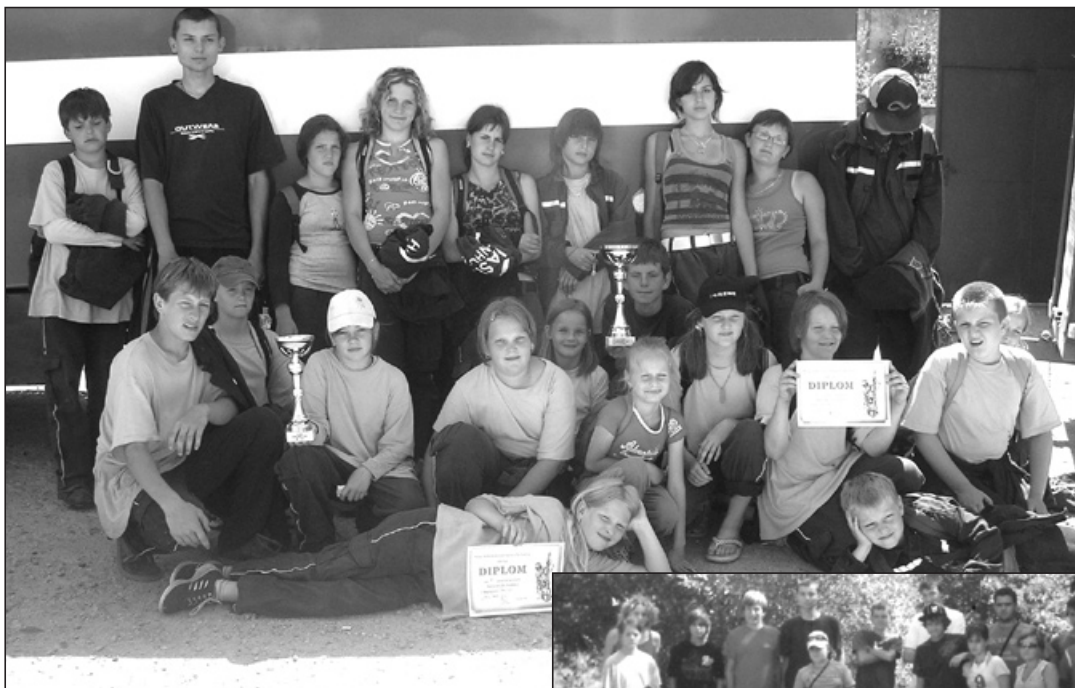
Ze soutěže v Šitbořicích