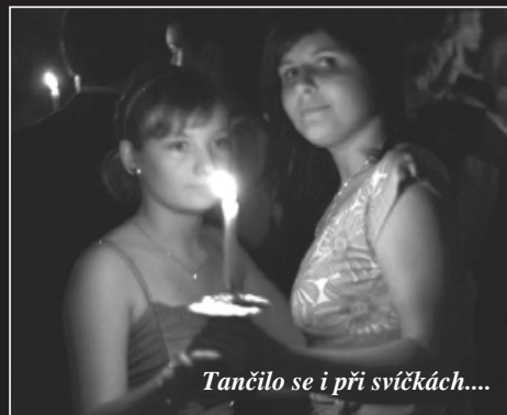
Tančilo se i při svíčkách....