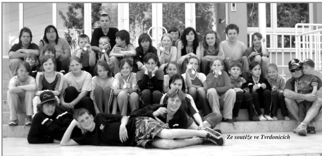
Ze soutěže ve Tvrdonicích