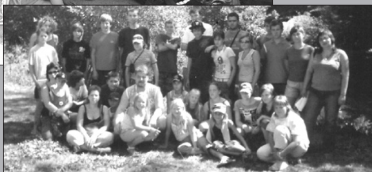
Z akce na Koberově mlýně 2007