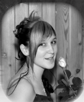
Květiny ke společenské akci neodmyslitelně patří