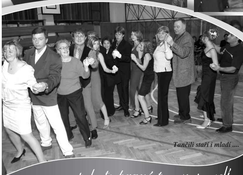
Tančili staří i mladí ....