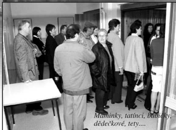
Maminky, tatínci, babičky, dědečkové, tety....