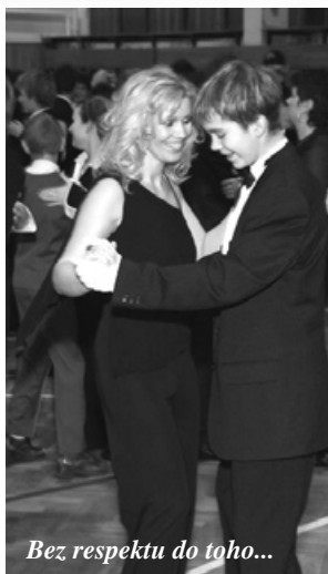
Bez respektu do toho...