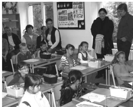
Poprvé ve škole