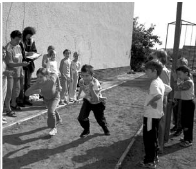
Maratón Emila Zátopka