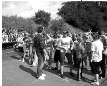
Branný den na druhé stupni