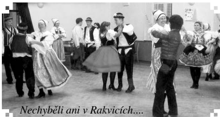
Nechyběli ani v Rakvicích....