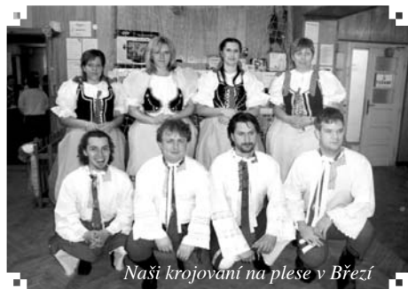
Naši krojovaní na plese v Březí