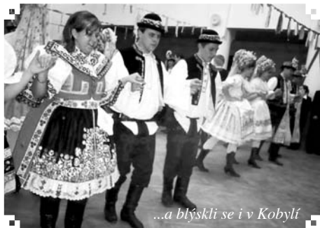
...a blýskli se i v Kobylí