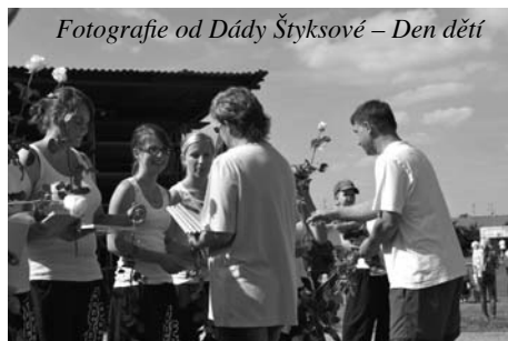
Den dětí