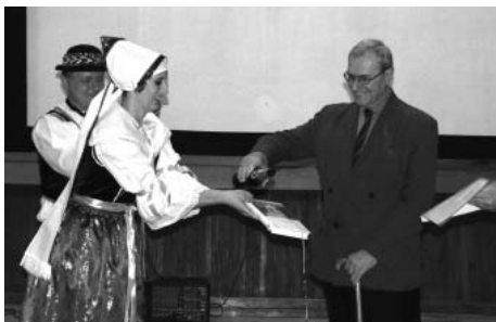
Křest knihy o Drholicích

V sobotu 14. 4. bude opět proveden sběr nebezpečného odpadu a elektroodpadu. Kontejner bude přistaven v 9.15 – 10.15 hod. na Výsluní a v 10.15. - 11.15. hod. na Dyjské ulici u garáží vedle stavebnin. Zde bude tak-