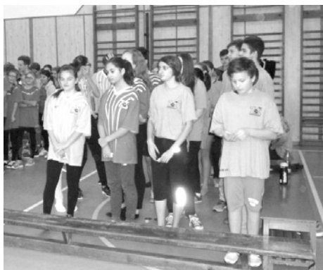
Pokračování na následující straně

Dva turnaje odehráli chlapci osmé a devá- té třídy o přeborníka okresu v košíkové. Na tom prvním ve Valticích si celkem bez problémů naše