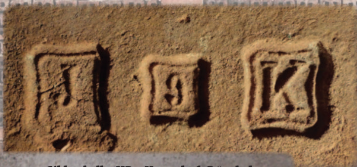
Cihly s kolky HD – Herrschaft Dürnholz