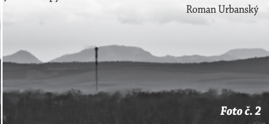
Foto č. 2