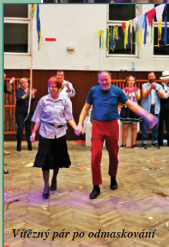
Vítězný pár po odmaskování

Jsme rádi, že nás neopustila přízeň sponzorů, kteří nám umožnili opět uspořádat krásnou a bohatou tombolu, mnoho rozmanitých a nápaditých masek a také návštěvníků plesu.